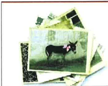
IL LIBRO Il disegno di copertina