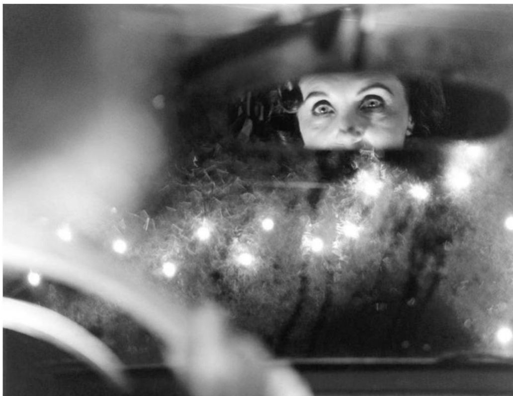
Una donna nello specchio di sé

Ritaglio Stampa ad uso esclusivo del destinatario. Non riproducibile