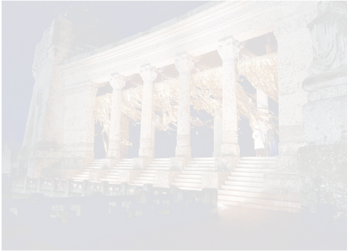
L'installazione "Golden Gate" di Danaiel Gonzalez all'ingresso del cimitero monumentale di Bergamo